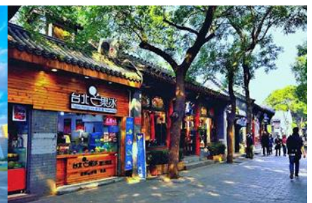
ชอยหนานหลัวกุ่ชื่อยี่ง