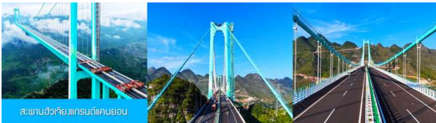
สะพานฮัวชิวกิงเกรนด์แคนยอน

ไกด์นำเสนอสถานที่ OPTIONAL TOUR แพคเกจเที่ยวชมตัวสะพาน รวมค่าบัตรนั่งลิฟท์แก้วขึ้นสู่ชั้นชมวิวบนทาวเวอร์ รวมค่ารถรับส่งจากศูนย์บริการนักท่องเที่ยวสู่ตัวสะพาน รวมกาแฟบนหอคอยชมวิวท่านละ 1 แก้ว อัตราค่าบริการ 380 หยวนหรือ 1,900 บาทต่อท่าน