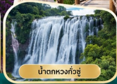
น้ำตกหวงกั๋วชู่