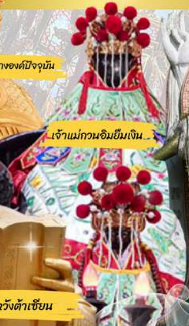
เจ้าแม่กวนอิมยืมเงิน