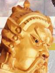
วัดแทงองค์ปัจจุบัน