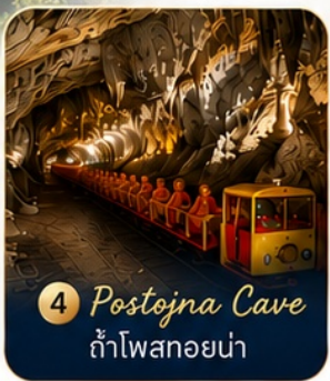
4 Postojna Cave ถ้ำโพสทอยน่า