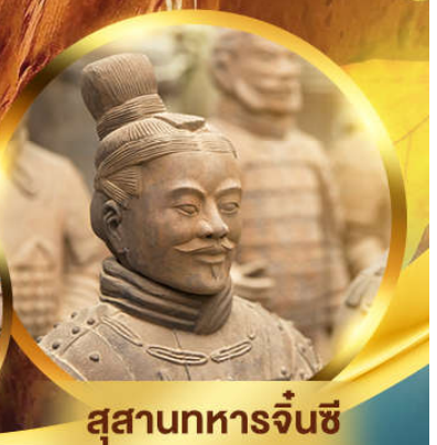
สุสานทหารจิ๋นซี