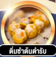
ต้มซ่าต้นตำรับ