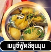
เมนูซีฟู้ดลิ้นยุบนุ่ม