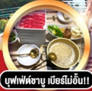
บุฟเฟ่ต์ชาบู เมื่อบริไม้อัน!!