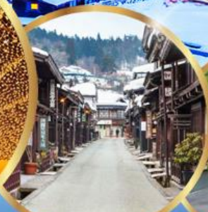
ทาคายาม่า