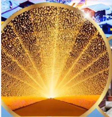
นาบาระ โนะ ซาโตะ