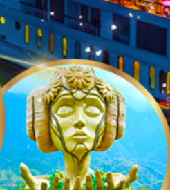
โมนาน่า คาเฟ่

ราคาเริ่มต้น 23,919 บาท รวมภาษีมูลค่าเพิ่ม 7%