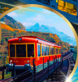
รถราง ซาปา