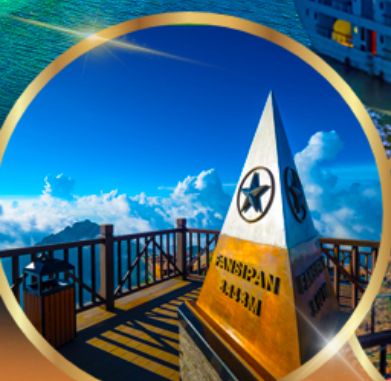
ยอดเขาฟานซีปัน

พักโรงแรม ★★★★★ GRAND SILK PATH SAPA HOTEL 2 คืน ROYAL CASINO HALONG HOTEL 1 คืน