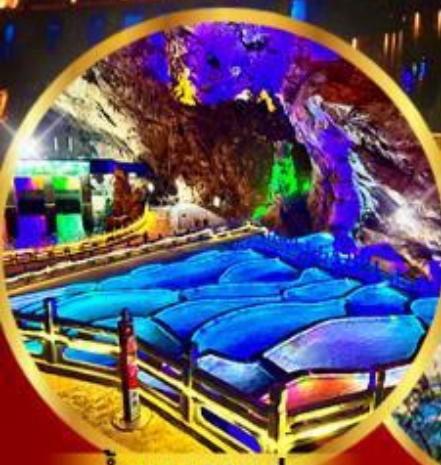
ถ้ำนกนางแอ่น