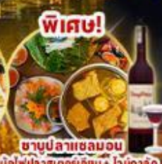
พิเศษ! ชาบูปลาลาเซลมอน หม้อไฟปลาสดอร่อยชิ้น • ไวน์ดาดิ