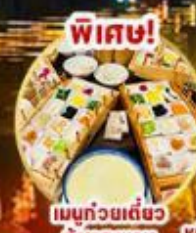
พิเศษ! เมนูกว่ายเต๋ยว ข้ามสะพาน