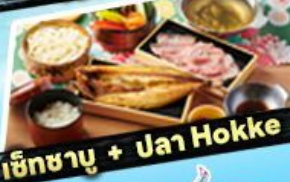
เซ็ทซาบู + ปลา Hokke