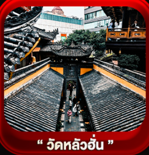
“ วัดหลิวฮั่น ”