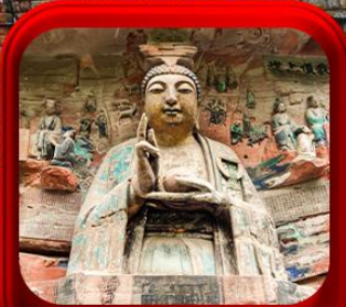
“ ผาคินแกะสลักต้าจู้ ”

บินตรงลงฉงชิ่ง • อุ้หลง หลุมฟ้าสะพานสวรรค์ • ระเบียบแกว • อุทยานเขานางฟ้า หงหยาดัง • นิ่งรถไฟกะลุดัก • ศาลาประชาคม (ด้านนอก) • หลงหมินฮ่าว มรดกโลกผาคินแกะสลักต้าจู้ • วัดหลิวฮั่น • ตึกตะเกียบ • หมู่บ้านโบราณสี่ซีไจว่