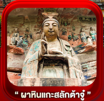
“ ผาหินแกะสลักต้าจู้ ”

บินตรงลงฉิง • อุโมงค์ หลุมฟ้าสะพานสวรรค์ • ระเบียงแก้ว • อุทยานเขานางฟ้า หงหยาดัง • นิ่งรถไฟคะลุดัก • ศาลาประชาชน (ด้านนอก) • หลงหมินฮ่าว มรดกโลกผาหินแกะสลักต้าจู้ • วัดหลิวฮั่น • ตึกตะเกียบ • หมู่บ้านโบราณสี่ซีโหว่