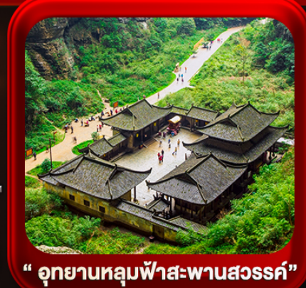
“ อุทยานหลุมฟ้าสะพานสวรรค์ ”