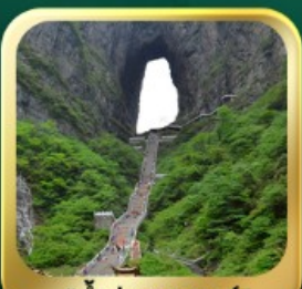
"กำประตูล่องเรือ"