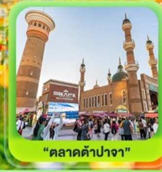
"ตลาดต้าปาจา"

ซินเจียงเหนือ ทะเลสาบโซลีมู๋ "น้ำตาหยดสุดท้ายของแอตแลนติก" • กุ่มหญ้านาราตี กุ่มดอกไม้เทียนซาน • ผ่านชมสะพานกั๋วจื่อโกว • ถนนหลิวซิงเจียง • ตลาดต้าปาจา