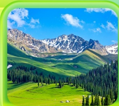
"กุ่มหญ้านาราตี"