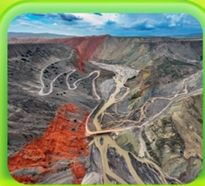
"แกรนด์แคนยอนคู่ชาวจื่อ"

ซินเจียงเหนือ ทะเลสาบโซลีมู๋ "น้ำตาหยดสุดท้ายของแอตแลนติก" • กุ่มหญ้านาราตี กุ่มดอกไม้เทียนซาน • ผ่านชมสะพานกั๋วจื่อโกว • ถนนหลิวซิงเจียง • ตลาดต้าปาจา