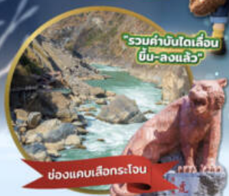
ช่องแคบเล็องกระโจน