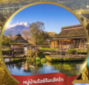
หมู่บ้านโฮชิโนะฮักโกะ