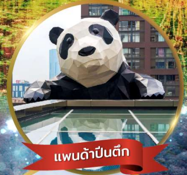
แพนด้ายักษ์

มหัศจรรย์ความงาม อุทยานจิวจ้ายโกว (รวมรถเหมาเที่ยวอุทยานเต็มวัน) ชมอุทยานหวงหลง (รวมกระเช้า) • สี่ดรุณี • อุทยานชวงเจียวโกว (รวมรถอุทยาน) เมืองเก่าซงพาน • ถนนคนเดินจินหลี่ + ไถ่กูหลี่ • ชมแพนด้ายักษ์จีนตึก