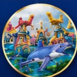
สวนสนุกกลางหลง โอเชียน คิงดอม