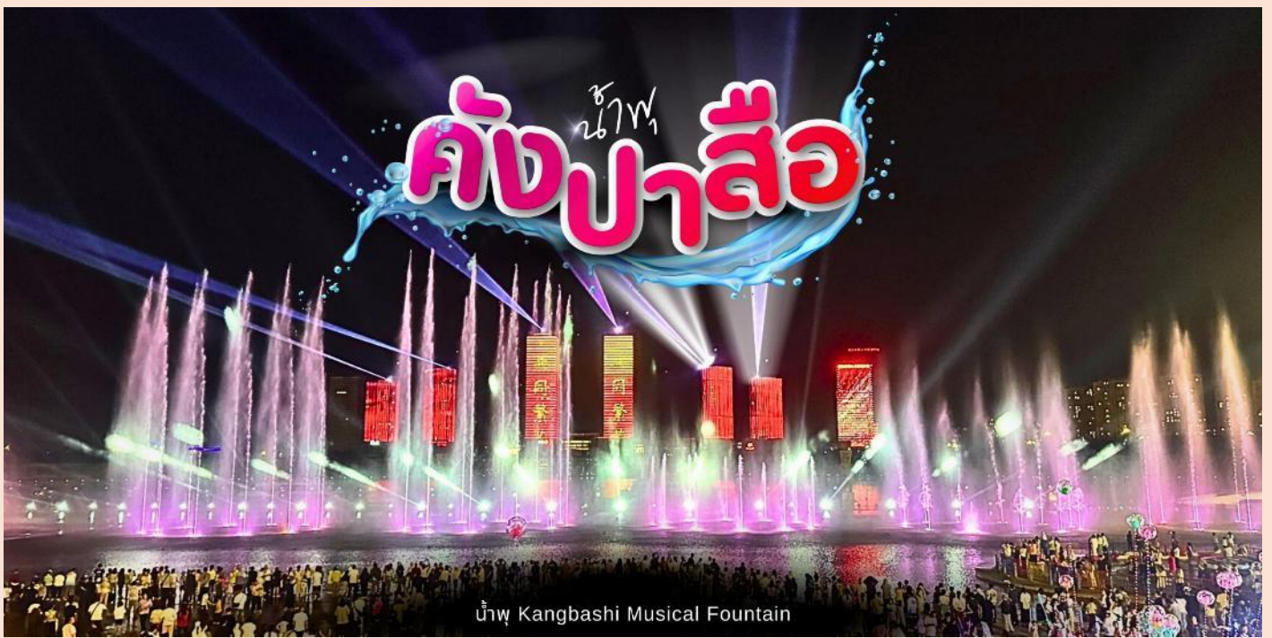
น้ำพุ Kangbashi Musical Fountain

DAY 6 เมืองออร์ดอส-วัดลามะ – ศูนย์วัฒนธรรมมองโกลหยวนหลิว - อนุสาวรีย์กองทัพเจงกิสข่าน - ถนนคนเดินคังปาซือ- สนามบินออร์ดอส – สนามบินสุวรรณภูมิ (กรุงเทพฯ) (เช้า/เที่ยง/-)