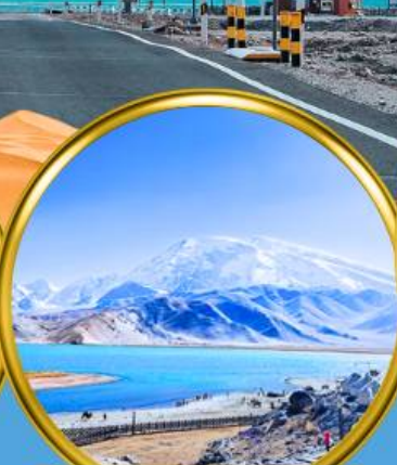
Kala Kule Lake