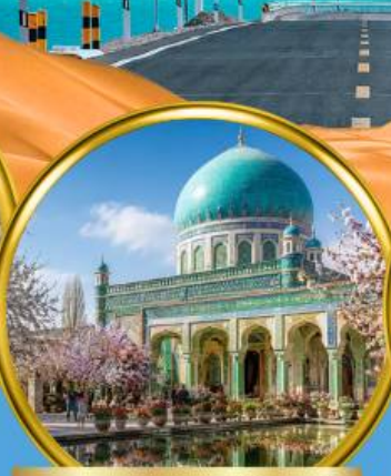
สุสานสมหอมเซียนเฟย