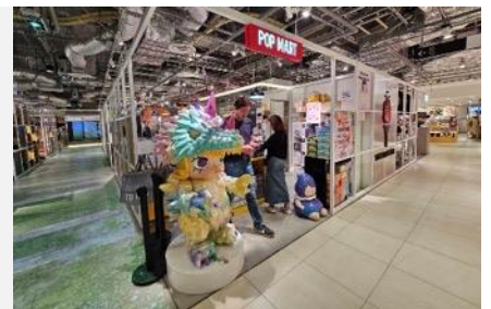
POP MART สายจุ่มถูกใจสิ่งนี้ !