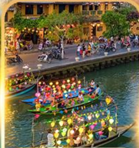
ล่องเรือลอยกระทง