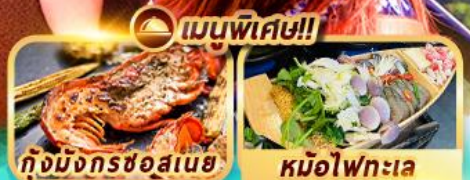
เมนูพิเศษ!!