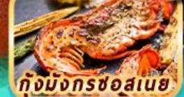
กุ้งมังกรชอสนาย