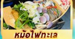
หม้อไฟทะเล