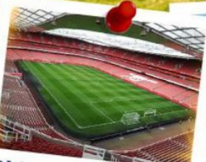
Old Trafford Stadium