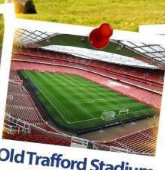
Old Trafford Stadium