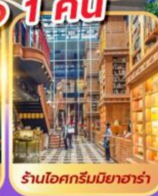
ร้านไอศกรีมมียาฮารา