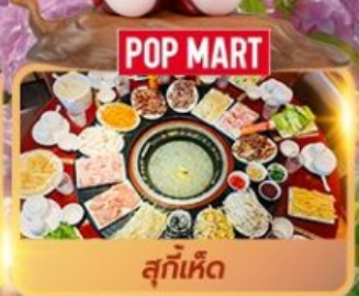
POP MART สุกี้เห็ด