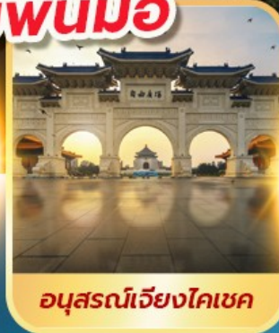
อนุสรณ์เจียงไคเชค