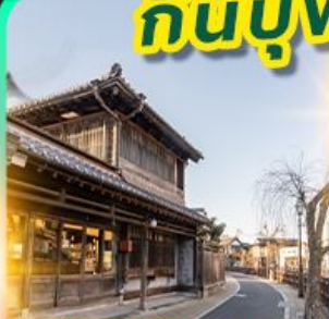
เมืองเก่าซาวาระ