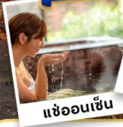
แอดออนเซ็น