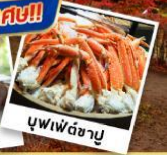
บุฟเฟต์ชาบู