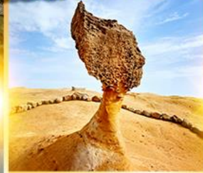
อุทยานหินเหย่หลิว