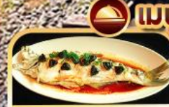
ปลาประจานริบตี