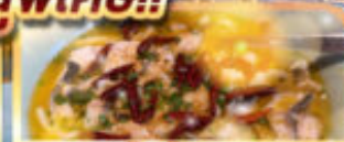
ปลาต้มพริกทอดตอง