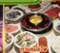
ทานหม้อไฟ