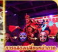
การแสดงเปลี่ยนหน้ากาก