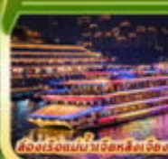
ส่องเมืองยามค่ำคืนที่ลี้ลับ