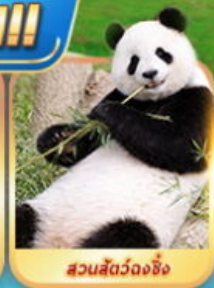
สวนสัตว์จงชิ่ง