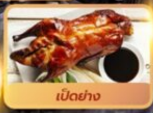
เป็ดย่าง