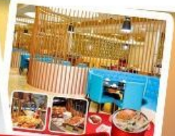
ก๊วยแม่น้ำ + HOTPOT SEAFOOD