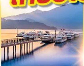
ทะเลสาบสุริยจันทร