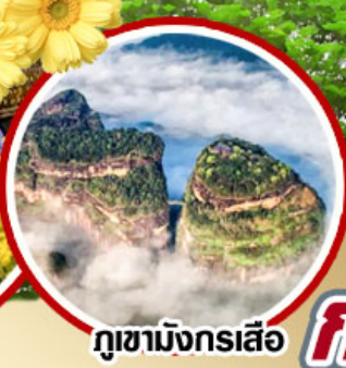
ชมทุ่งดอกเก๊กฮวย สีเหลืองสดใส