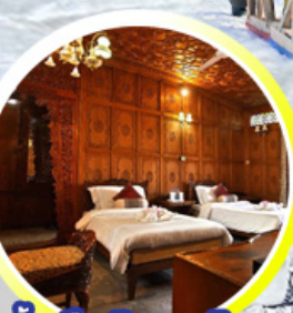
บ้านเรือ..วิมานบนดิน