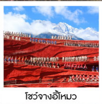
โซ่วจางอีไหว