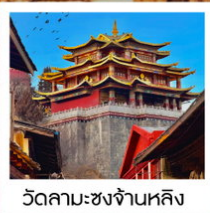
วัดลามะชงจ่านหลิง