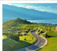
กุเซาอวี่นเซียงซาน