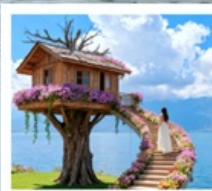
หมู่บ้านเหวินปี้

เมืองโบราณต้าหลี่ / นั่งเรือสู่เกาะเสี่ยวผู่โถว / ซานโตรินี่ (รวมรถแบตเตอรี่) / ถนนชางเอ๋อร์ต้าเต้า / ภูเขาอวิ้นเซียงซาน / ต้าซ่าท่าเรือหลงกัน โค้ง S ทะเลสาบเอ้อไห้ / หมู่บ้านโบราณสี่จิว / หมู่บ้านเหวินปี้ / ชมดอกไม้ตามฤดูกาล