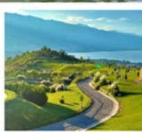
ภูเขาอวิ้นเซียงซาน