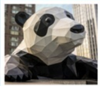
ห้าง IFS แพนด้าป็นตัก