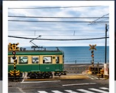
รถไฟเอโนะเดิน