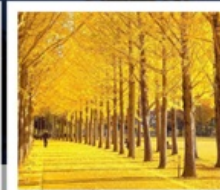
สวนเอ๊กชิโป