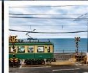
รถไฟเอโนะเด็น