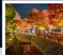
อุโมงค์เมบิล