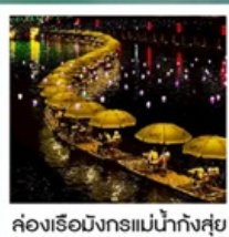
คลองเรือมังกรแม่น้ำก้งซู่