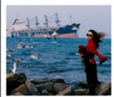
เรือบลูวิส

หอคอยทาลเวลา / รูปปั้นปลาวาฬ / ถนนโบราณเตาหยาง / ย่านสงโขว่ 1920 / เมืองเว่ยไห่ / ถนนฮั่วจวีปา / จตุรัสประตูแห่งความสุข ย่านฮั่นลอฟ่าง / เรือบลูวิส / หาดซาจ้อฮั่ว / ถนนหลงเจียง / สะพานจ้านเจียว / หาดไซเบอร์ No. 3 ถนนจงซาน / โบสถ์ St.Emill / จตุรัส 54 / ศูนย์เรือใบโอลิมปิก / พิพิธภัณฑ์มิแยร์ชิงเต่า / ถนนไท่ตง / ท่าเรือประมงเหยียนโกะ