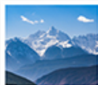
ภูเขาหินปะโพหม่าง