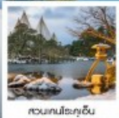
สวนทงโมะกุจิอัน