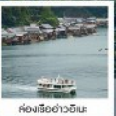
ค่องเรือฮอนอ่าวฮิเมะ