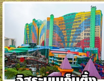
อิสระบนเก็นตัง