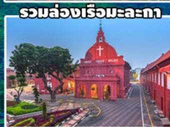
รวมล่องเรือมะละกา