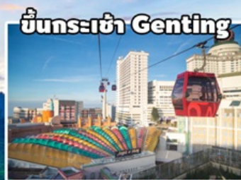
ขึ้นกระเช้า Genting

คาเมร่อน - เก็นติ้ง - มะละกา-กัวลาฯ 4วัน3คืน โดยสายการบิน มาเลเซีย แอร์ไลน์ (MH)