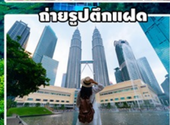
ถ่ายรูปตึกแฝด