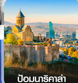
ป้อมนารีกาล่า