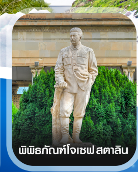
พิพิธภัณฑ์โจเซฟ สตาลิน

คอนเฟิร์มออกเดินทาง ทุกพีเรียด 2 ท่านขึ้นไป