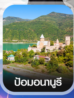
ป้อมอนาบูรี