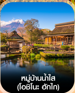
หมู่บ้านน้ำใส (โอบิโนะ อักโก)