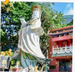
เจ้าแม่กวนอิมรพัสลเบย์