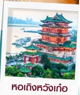
หอถึงหวังเก้อ